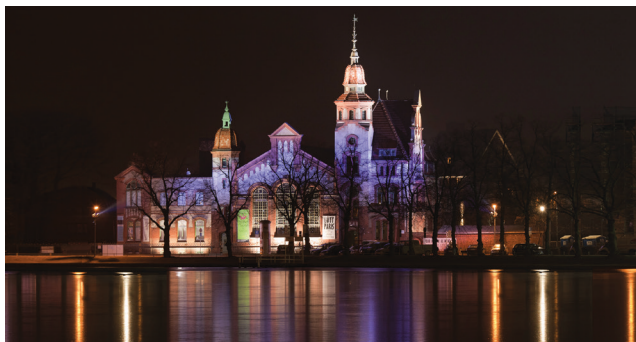
KUNSTVEREIN FÜR MECKLENBURG & VORPOMMERN SCHWERIN e.V.

Der Kunstverein Schwerin wurde 2002 gegründet, um in Mecklenburg-Vorpommern ein Forum für zeitgenössische bildende Kunst zu schaffen. Seither wurden 75 Ausstellungen und Projekte realisiert, die die Kunst- und Kulturszene bereicherten. Seit Juli 2007 finden Ausstellungen und Veranstaltungen in den ehemaligen Industriehallen des E-Werks am Pfaffenteich statt. Pro Jahr werden sechs Wechsausstellungen mit internationalen und regionalen Künstlerinnen und Künstlern realisiert, begleitet von Filmabenden, Vorträgen, Diskussionsveranstaltungen und Angeboten zur Kunstvermittlung für Kinder und Erwachsene.