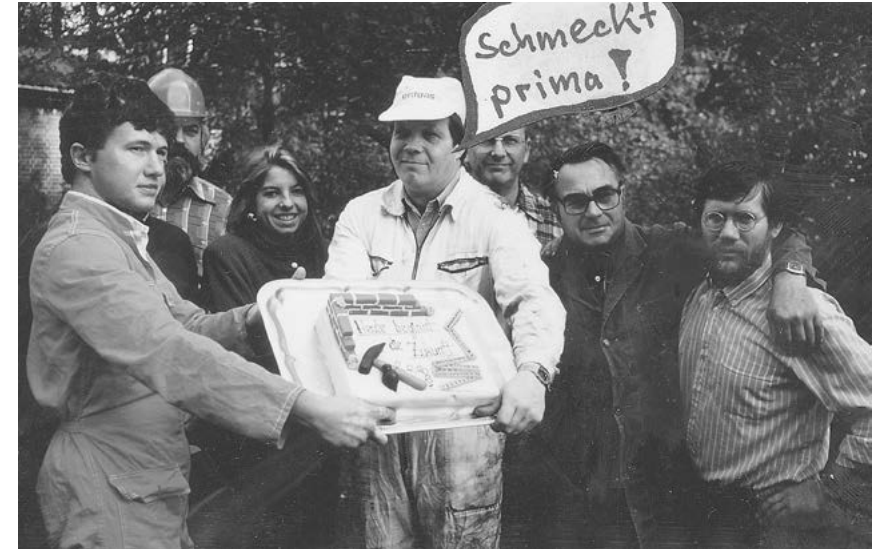
Ein Konditor und eifriger OK-Produzent kreierte gerne sehr, sehr süße OK-Utensilien. Er selbst isst nichts Süßes.

Auf ihrer Sitzung am 10. und 11. Mai 1978 beschlossen die Ministerpräsidenten der Länder, entsprechend der Empfehlung der Kommission für den Ausbau des technischen Kommunikationssystems, die Durchführung von Pilotprojekten. Für die noch zu führenden Verhandlungen mit dem Bund wurden als Standorte Berlin, Ludwigshafen-Mannheim, Nordrhein-Westfalen (zunächst waren Köln oder Wuppertal vorgesehen, später einigte man sich auf Dortmund) und München benannt. An der Durchführung der Pilotprojekte sind nach der Entscheidung der Ministerpräsidenten die Rundfunkanstalten, eine öffentlich-rechtliche Körperschaft und eine öffentlich-rechtliche Anstalt beteiligt, wobei auch private Veranstalter bei der Erprobung zugelassen werden.