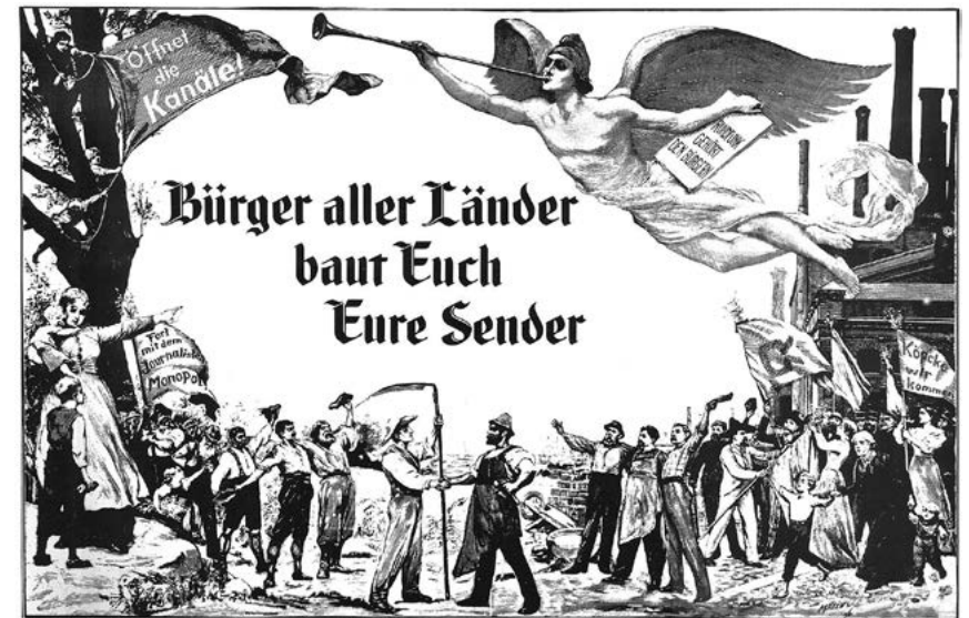
Der Aufruf zum 1. Mai des Jahres 1901 wollte 85 Jahre später einfach umgedeutet werden.

„Im Anfang war das Wort“ heißt es schon im Johannes-Evangelium. Und weil der Drang, sich mitzuteilen, zu kommunizieren und am öffentlichen Diskurs teilzuhaben auch knapp 2000 Jahre später ungebrochen angehalten hat, war es nur logisch, dass irgendwann auch die Idee der Offenen Kanäle (OK) entstehen würde. Bereits Ende der siebziger Jahre befasste man sich in der Bundeszentrale für politische Bildung in Vorbereitung der anstehenden Kabelpilotprojekte mit der Möglichkeit, eine weitere Säule in das bis dahin ausschließlich öffentlich-rechtlich geprägte bundesdeutsche Rundfunksystem einzuführen. Die Idee war gut, aber eigentlich war man damit der Zeit voraus. Schließlich stand zunächst die Einführung des privaten Hörfunks und Fernsehens an, die mit den neuen Möglichkeiten der Kabelzukunft auch über die entsprechenden Ausstrahlungsmöglichkeiten verfügen sollten. Während im Hörfunk mit der Erweiterung des UKW-Bandes von 100 auf zunächst 104 und später bis 108 Megahertz neue Frequenzen gewonnen werden konnten, war dies beim terrestrischen, analogen Fernsehen über Antenne nur bedingt möglich. Da kam die Kabelverbreitung wie gerufen, um SAT.1 und RTL ab 1984 zum Siegeszug in die deutschen Wohnzimmer zu verhelfen.