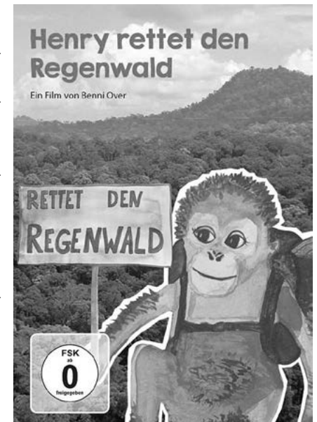
DVD-Cover „Henry rettet den Regenwald“.