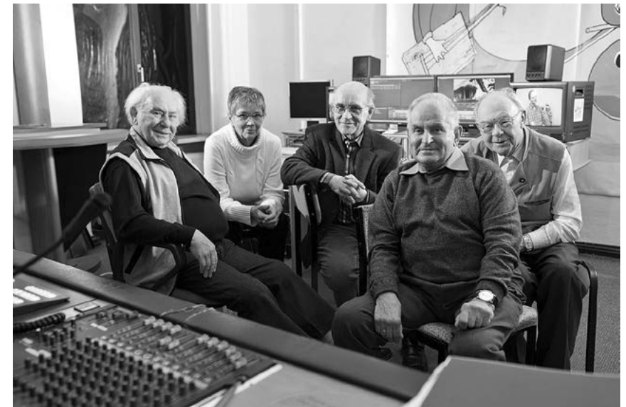
Senioren machen im Offenen Kanal Magdeburg regelmäßig Programm.

Medienkompetenz im Videobereich mit dem Aufzeigen von künftigen Berufschancen verbunden werden. Hinzu kam die länderübergreifende Zusammenarbeit, etwa mit Partnern in Frankreich, England, Spanien oder Polen, die sich in künftigen Projekten sicher fortsetzen wird.“ Auch Nachrichten aus einzelnen Stadtteilen haben ihren festen Sendeplatz im Programm, etwa in Form von „Olven TV“, dem Stadtteilmagazin für Olvenstedt. Im Magdeburger Monatsmagazin „M hoch Drei“ wird das gesamte Stadtgeschehen abgebildet. Auch die Senioren kommen regelmäßig zu ihrem Recht. Es gibt eine eigene Servicedredaktion „50 plus“, die von einer Reise ebenso berichtet wie von einer Pflegefachtagung. Zu einer Sendung mit Kultstatus entwickelt hat sich das Straßenbahnmagazin „Haltestelle“, das deutschlandweit im Netz eine große Fangemeinde hat. Seit 2014 wird das interkulturelle Magazin „One World“ ausgestrahlt, das in Kooperation mit der Clearingstelle der Caritas für unbegleitete, minderjährige Flüchtlinge produziert wird und sich dem Themenkreis Flucht, Migration und Integration in seiner gesamten Bandbreite widmet. Großes Glück hat der Offene Kanal Magdeburg in der Unterstützung durch engagierte Freiwillige im sozialen Jahr in der Kultur und mit Freiwilligen aus anderen europäischen Ländern, die neue Impulse bringen und einen wertvollen Beitrag leisten, um den