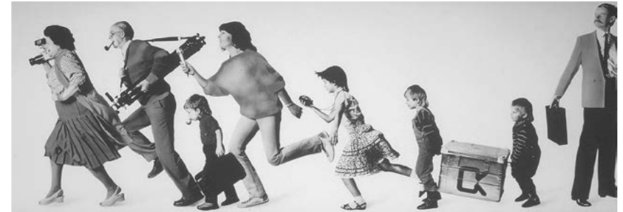
Gewinner beim Plakatwettbewerb für das Kabelpilotprojekt Dortmund – und der Offene Kanal hatte sein Motto.

“ Wir sehen gerade in diesem Offenen Kanal eine gute Möglichkeit, das Engagement und die Beteiligung der Bürger an gesellschafts- und kommunalpolitischen Fragen zu verstärken und damit der Idealvorstellung einer partizipativen Demokratie näher zu kommen. Daß hierbei – auch über das Anfangsstadium des Versuchs hinaus – bestimmte technische, organisatorische und finanzielle Hilfestellungen unumgänglich sein werden, zeigen nicht nur entsprechende Erfahrungen im Ausland. [...]