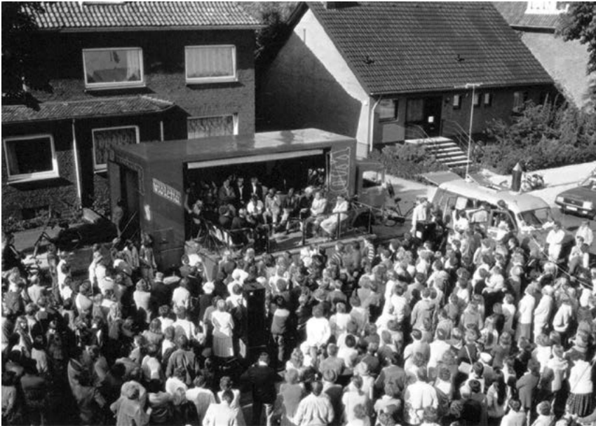
Dankbar angenommen: Die erste Mitmach-Sendung im Radio findet schnell ihr Publikum.

hochgebildeten, mit schüchternen und prominenten Menschen am Mikrofon im Dialog-Mix: das war damals – nicht nur für mich – etwas völlig Neues und eine deutlich größere Herausforderung. Es dauerte eine Weile, bis ich meine Rolle als Dolmetscherin zwischen Expertinnen und Verantwortlichen und dem „normalen“ Volk gefunden hatte.