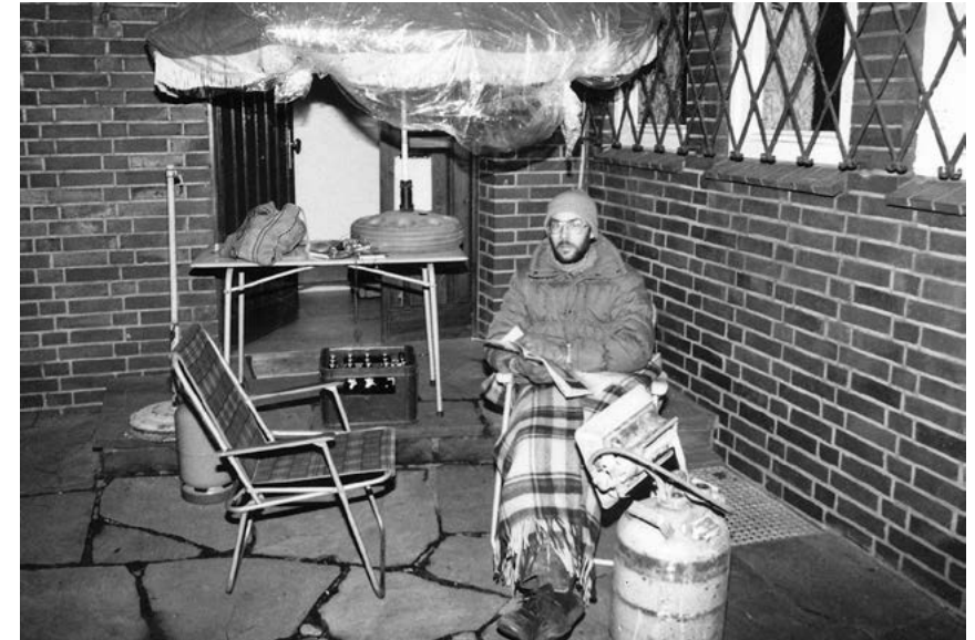
Was tut man, um im Dortmunder Offenen Kanal die allererste Sendung anmelden zu können? Man schiebt Nachtwache!

Einvernehmen mit den Kommunen erfolgen. Im Hinblick auf die kommunikationspraktische Bedeutung des Modellversuchs hat die Landesregierung von Baden-Württemberg medienpädagogische Begleitmaßnahmen für die Teilnehmer des „Zwei-Wege-Fernsehens“ vorgeschlagen. Dass die Landesregierung von Baden-Württemberg später von der Beteiligung an dem Pilotprojekt Abstand nehmen würde und selbiges nur in Ludwigshafen durchgeführt werden konnte, war zum damaligen Zeitpunkt noch nicht absehbar.