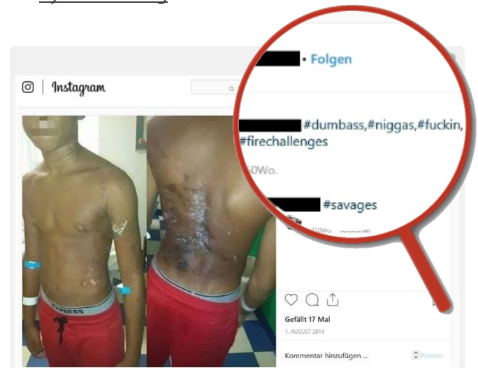
Mobbing-Hashtags in einem Post, der einen Jungen mit Verletzungen durch die "Fire-Challenge" zeigt.

Ernstgemeinte Warnungen gibt es in den Videos kaum. Stattdessen werden Challenges, die schief gelaufen sind, so genannte Fails (englisch von to fail = scheitern), auch ins Netz gestellt und bekommen zu meist sogar noch mehr Klicks. Der Spott und die Schadenfreude anderer Userinnen und User zeigen sich auch oft in den zahlreichen Kommentaren, die derartige Videos erhalten. Dadurch, dass man die Person vor der Kamera nicht kennt, sinkt das Mitgefühl und die Hemmschwelle. Hier liegen auch große Gefahren für Cybermobbing .